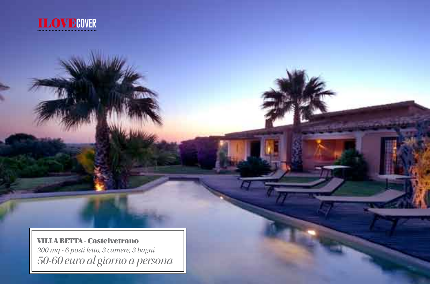
VILLA BETTA - Castelvetrano 200 mq - 6 posti letto, 3 camere, 3 bagni 50-60 euro al giorno a persona