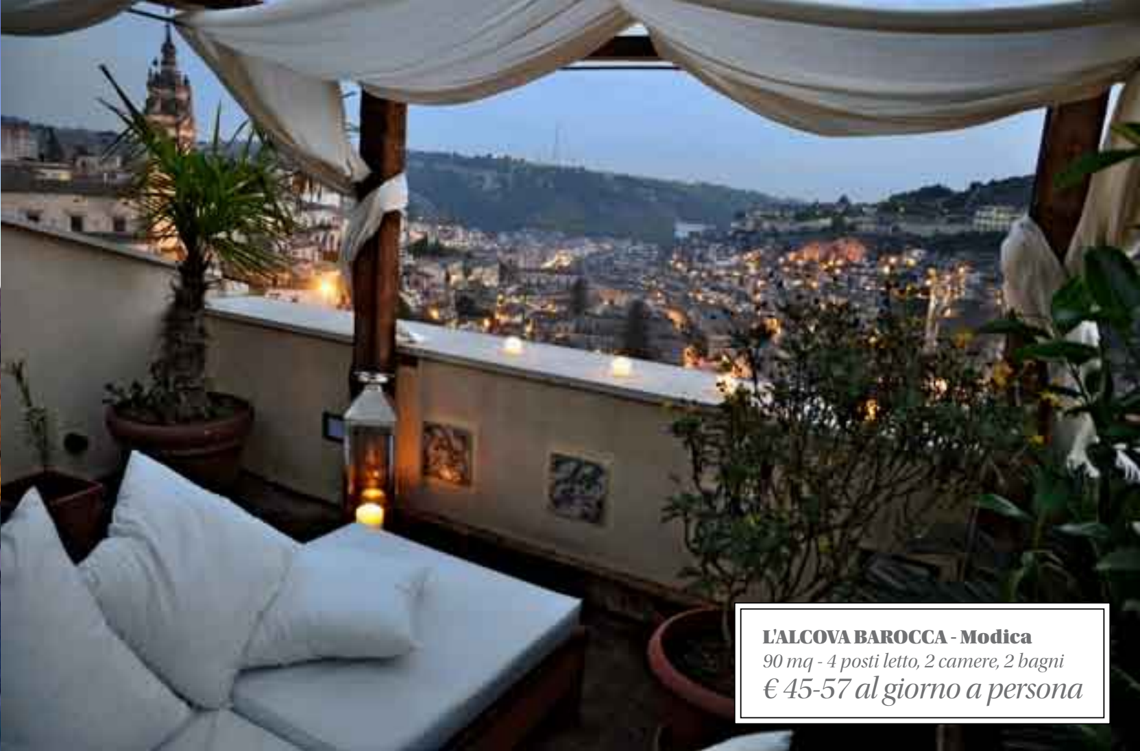
L'ALCOVA BAROCCA - Modica 90 mq - 4 posti letto, 2 camere, 2 bagni € 45-57 al giorno a persona