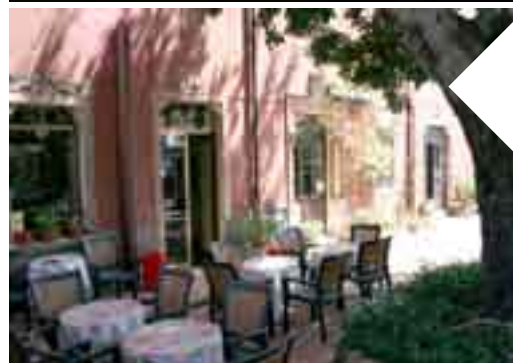
B&B VILLA ASTORIA Taormina 7 camere € 90 al giorno a coppia