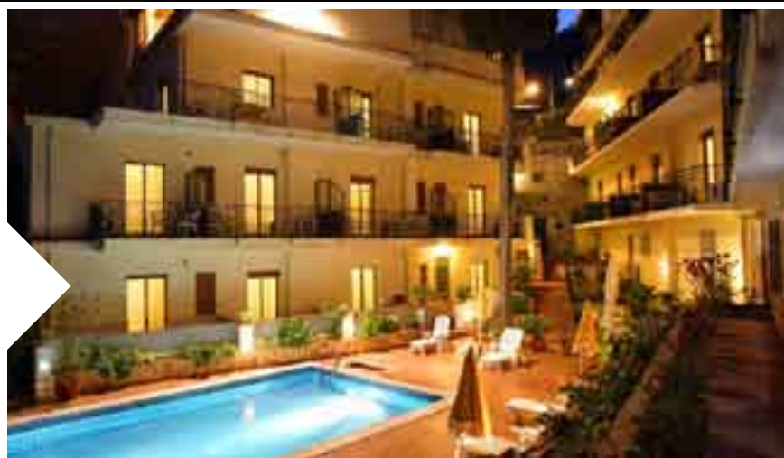
HOTEL SOLEADO Taormina 33 camere € 50-65 al giorno a persona