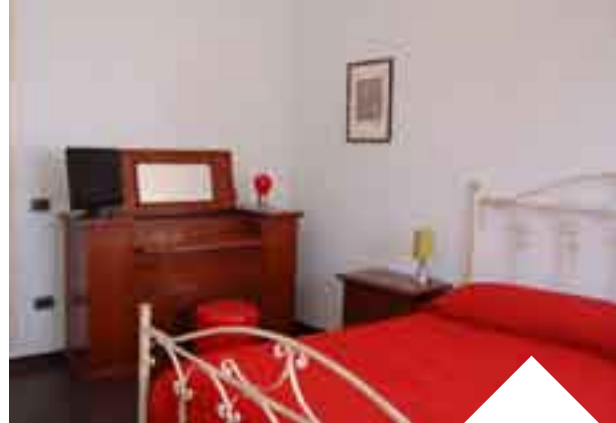
CASA VACANZA ROBERTA - Sciacca 5 posti letto €16 al giorno a persona

Si chiamano, invece, Cheap & chic (www.cataniacheapandchic.com) gli appartamenti al centro di Catania con formula e prezzi che oscillano dai 18 ai 38 euro a notte a persona. Possibilità anche di fare escursioni sull'Etna o gite in barca a vela. Sono gli stessi proprietari, poi, a suggerire ai loro ospiti di avventurarsi in un tour gastronomico tra le vie della città etnea (il B&b propone, tra l'altro, una convenzione con un ristorante nel centro storico con menu completi a partire da 10 euro a persona). Si parte al mattino con "una granita ai gelsi o alla mandorla, rigorosamente servita con brioche da gustare seduti al caffè del Duomo di fronte alla Cattedrale barocca e a 'u liotru', mitico elefante simbolo della città". Il viaggio alla scoperta del cibo continua con involtini di pesce spada o i piú tipici "masculini" e "sarde a beccaficu", accompagnati da caponata o parmigiana. Un tripudio di melanzana da assaggiare in uno dei tanti ristoranti catanesi tra cui Ambasciata del mare (piazza Duomo, 6 - tel. 095-341003). E dulcis in