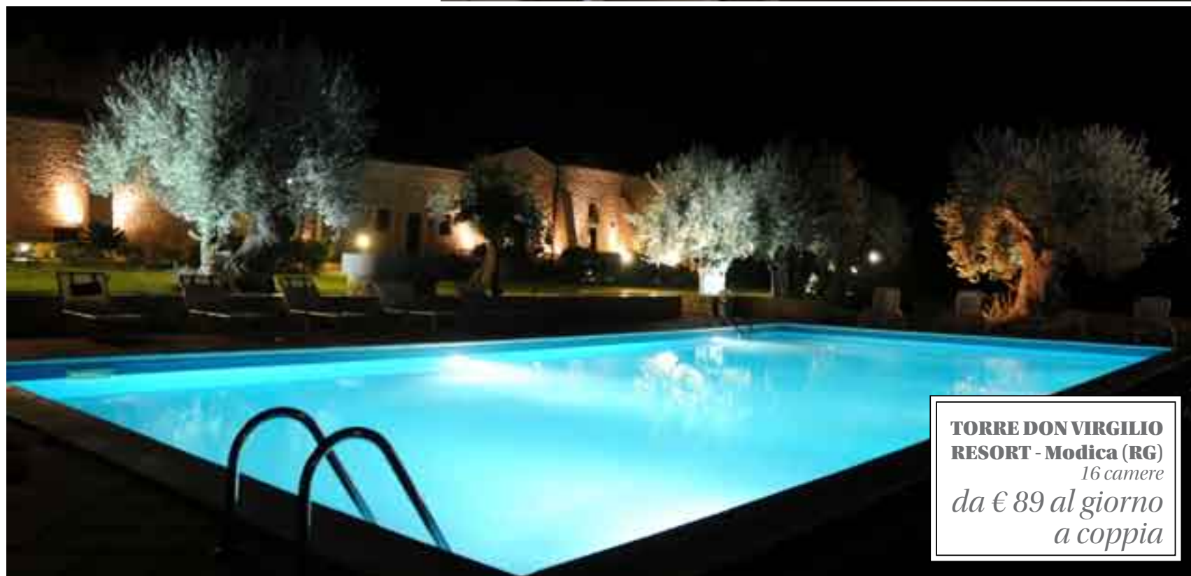
TORRE DON VIRGILIO RESORT - Modica (RG) 16 camere da € 89 al giorno a coppia