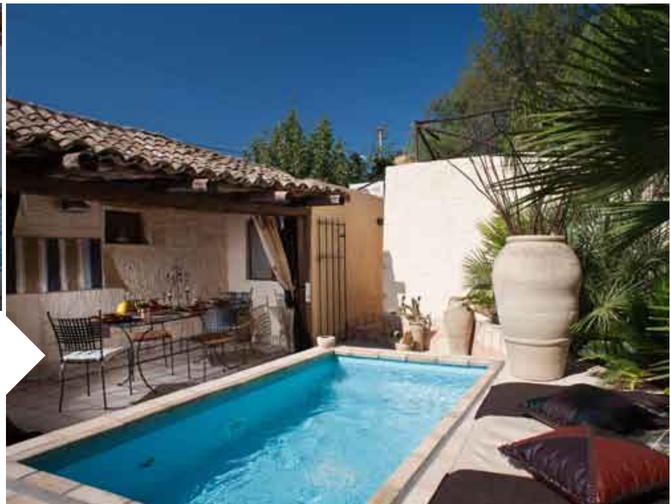
RUSTICO TANGITANO Erice 70 mq - 4 posti letto, 2 camere, 1 bagno € 35-45 euro a notte a persona