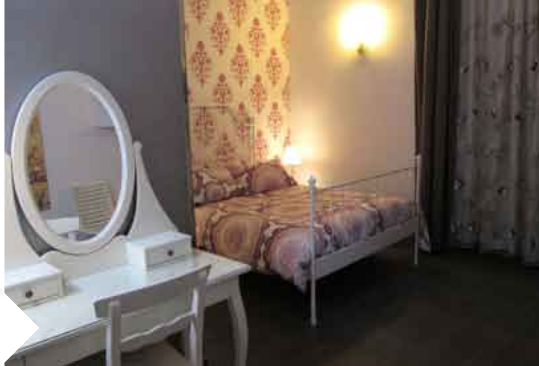
B&B CHEAP & CHIC - Catania 4 camere €18-38 al giorno a persona